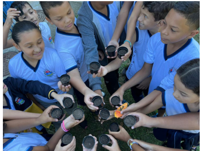
Programa Hortas – As crianças também aprendem sobre preservação ambiental

No mês de maio, foi realizado o I Workshop sobre a Utilização de Horticultura como Ferramenta Transdisciplinar. Ao todo, 62 pessoas, entre responsáveis de alunos multiplicadores do Programa Hortas e funcionários das unidades que recebem o programa, participaram do evento na Casa Porto.