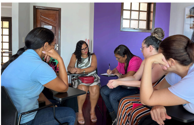
Programa Hortas – Casa Porto recebe comunidade para treinamento sobre educação ambiental

O Programa Hortas é uma iniciativa do Porto que busca promover a horticultura como uma prática educativa integrada, reforçando a importância da sustentabilidade e da aprendizagem prática.