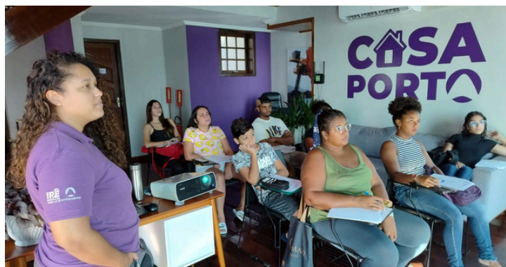
Projeto Despertar – Curso de Inglês

O Projeto Despertar continuou abrindo oportunidades de cursos para membros da comunidade na Casa Porto. Em junho, ocorreram encontros do Workshop de Técnicas básicas de Redação, leitura e oratória. Em 2024, também já foram oferecidos Curso de Inglês e Curso de Instalação Elétrica Predial, com aulas sempre presenciais.