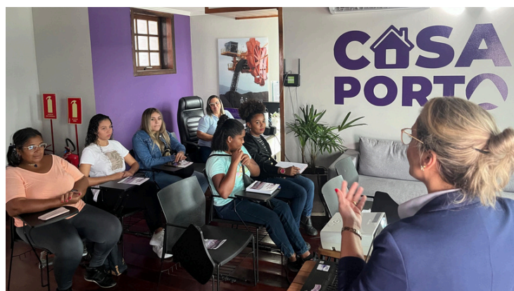
Projeto Despertar e Programa de Comunicação Social – Workshop de Redação aconteceu na Casa Porto

Após seis meses de atividade, o Curso de Inglês encerra um belo ciclo com a turma 1 de 2024, com total de 40 horas de aulas ministradas por voluntários do Porto Sudeste. Sucesso aos participantes com os novos conhecimentos!